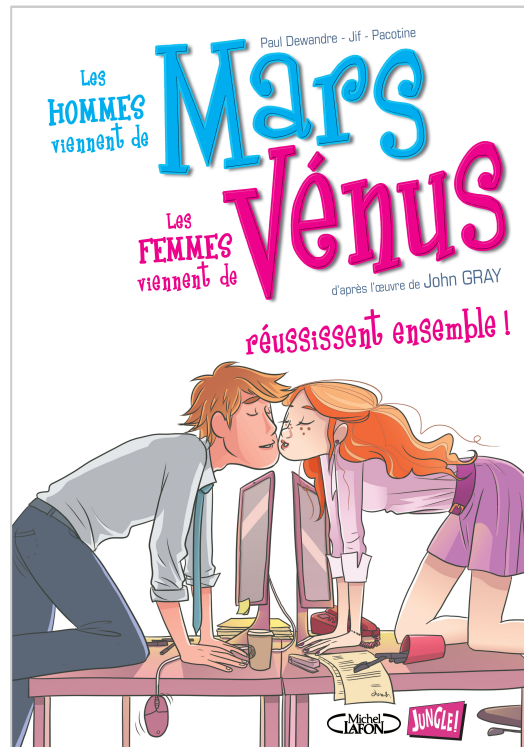
Volume 3 – Succeeding together