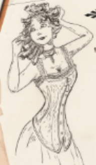
Femme portant Le Corset Idéal